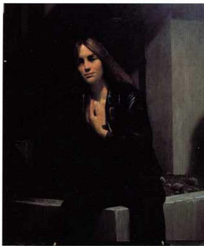
Uten tittel , 110 x 98 cm, olje på lerret, 1995-97

-Jeg tror ikke at behovet for å skape figurativ gjenkjennelighet er skapt av den moderne digital- og mediaverden, men springer ut fra en type primitivitet, et behov for sanselighet og for å danne bilder ut fra sine egne mentale og psykiske prosesser som er figurative.