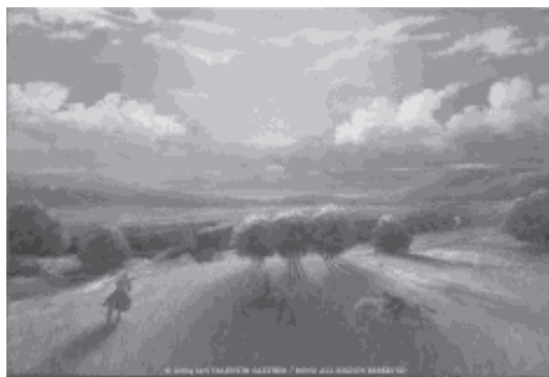
Jan Valentin Sæther: Into the great wide open, 1996. Olje på lerret. (Original i farger.)